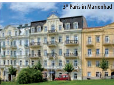
3* Paris in Marienbad