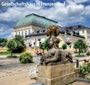
Gesellschaftshaus in Franzensbad