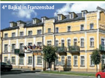
4* Bajkal in Franzensbad