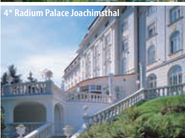
4* Radium Palace Joachimsthal