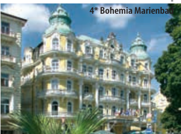
4* Bohemia Marienbad