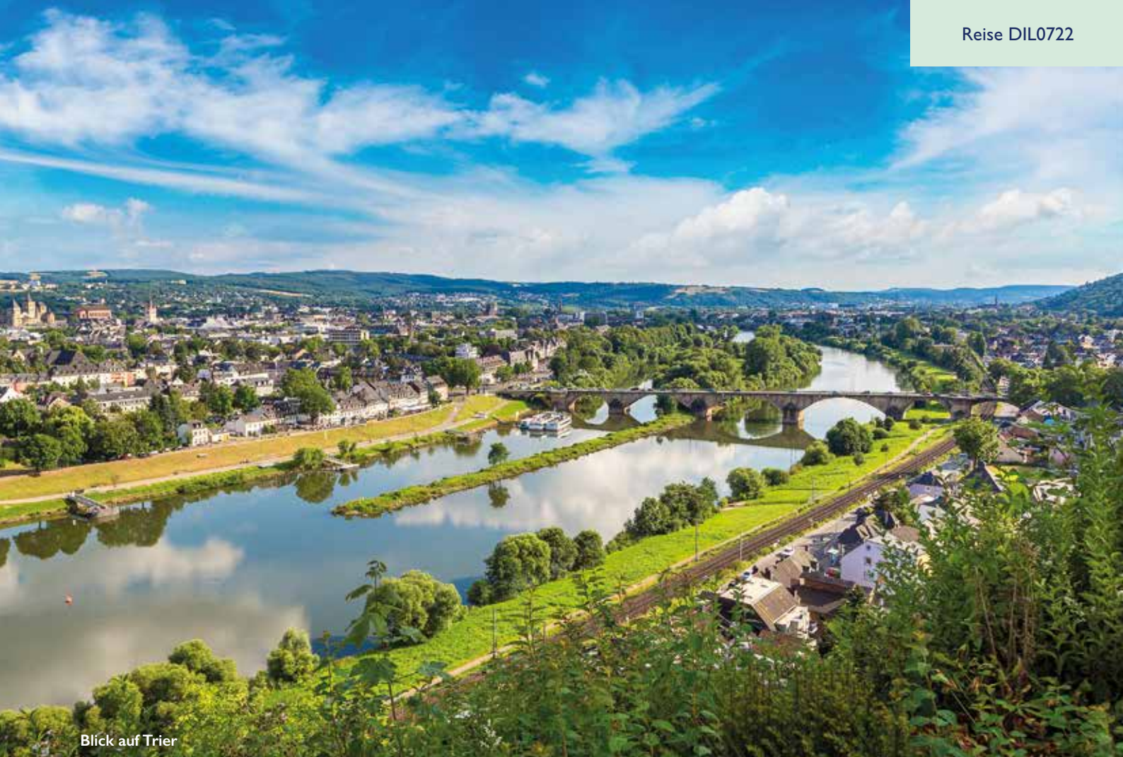
Blick auf Trier