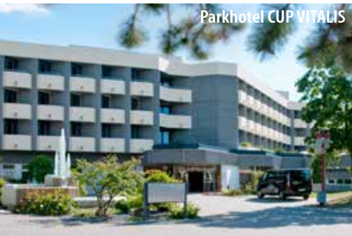
Parkhotel CUP VITALIS