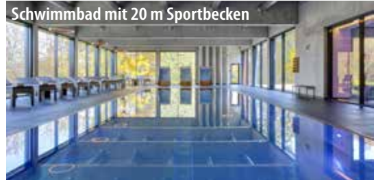
Schwimmbad mit 20 m Sportbecken

Zur kostenlosen Nutzung: Schwimmbad mit 20 m Sportbecken (außerhalb der Kurszeiten), Sonnendeck, 33°C warme VITAL-Quelle mit Sprudelliegen und Massagedüsen, große Saunalandschaft mit Salzsaua (45°C), finnischer Sauna (90°C) sowie 60°C-Bio-Sauna mit großzügigem Ruhebereich und Wellness-Schaukeln sowie zwei separaten Damensaunen.