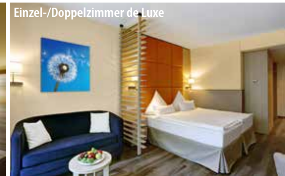
Einzel-/Doppelzimmer de Luxe

Bad Kissingen liegt an der fränkischen Saale, südlich der Rhön im Bundesland Bayern und gehört seit 2021 zum UNESCO-Welterbe „Die bedeutendsten Kurstädte Europas“. Der historische Kurort verkörpert das Phänomen der europäischen Kur auf besondere Art und Weise. Das Bild der Stadt wird vor allem durch die prächtigen Parks und die prunkvollen historischen Bauten geprägt. Hier stehen der Kurpark mit Wandelhalle und Regentenbau sowie die Bayerische Spielbank hervor. Besonders sehenswert sind auch das Bismarck-Museum und die historische Altstadt mit Geschäften und typisch fränkischer Gastronomie. Mit dem CUP VITAL Service-Taxi reisen Sie ganz bequem von Zuhause ins Hotel und zurück!