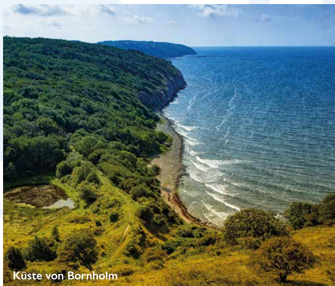
Küste von Bornholm

Mit Bornholm und Kopenhagen noch zwei unterschiedliche Seiten von Dänemark entdeckt, nehmen Sie einen Koffer voller Erinnerungen mit nach Hause.