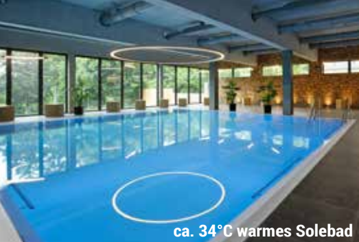
ca. 34°C warmes Solebad