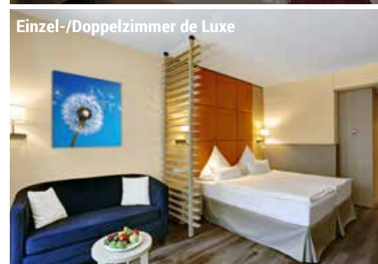
Einzel-/Doppelzimmer de Luxe