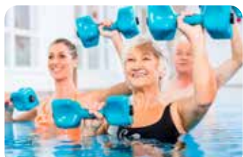
mit AQUA KINETIK, RÜCKENGYMNASTIK u. v. m.

Durch den Einsatz verschiedener Hilfsmittel (z. B. Hanteln) werden unterschiedliche Muskeln schonend trainiert.