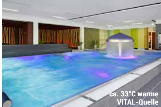
ca. 33°C warme VITAL-Quelle